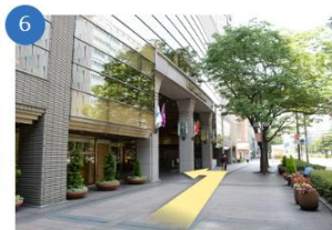
ホテル日航福岡に到着

スターバックスから右に50メートルほど進むと、コンビニがあります。そのまままた、直進します。