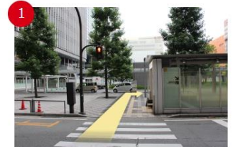
バスセンター前の横断歩道を渡る