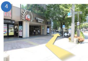
横断歩道を右に進む

横断歩道渡ると、福岡朝日ビルの1階にスターバックスがありますので、歩道を右に進みます。