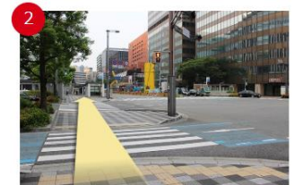
2つの横断歩道を渡る

左手にある2つの横断歩道を渡ります。渡ってすぐ右手に福岡朝日ビルへ渡る横断歩道があります。