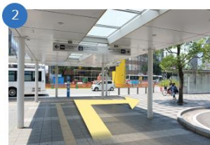
大通りから横断歩道へ

JR博多口を出ると正面に朝日新聞と書かれた福岡朝日ビルが見えます。福岡朝日ビルに向かって直進します。