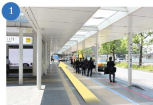
博多口を出て正面の福岡朝日ビル方面へ

JR博多口を出ると正面に朝日新聞と書かれた福岡朝日ビルが見えます。福岡朝日ビルに向かって直進します。