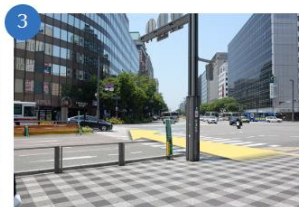
福岡朝日ビルに向かって横断歩道を渡る

JR博多駅の博多口から50メートルほど直進すると大通り(佐世通)があります。大通りから右に20メートルほど進むと、福岡朝日ビルへ渡る横断歩道があります。